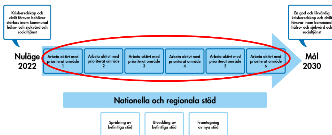
Figur 2 Processbeskrivning av den långsiktiga planen

Socialstyrelsen och länsstyrelserna har en viktig uppgift att stödja kommunernas arbete med den kommunala hälso- och sjukvårdens och socialtjänstens krisberedskap och civilt försvar och redovisar här förslag om hur beredskapen kan stärkas och vidareutvecklas både strukturellt och inom vilka